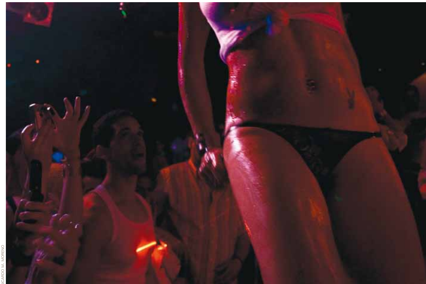
■ Los locales ofrecen protección y sueldo seguro a las chicas.

Estas prácticas bastante habituales, no siempre son solicitadas por los clientes. «A veces somos nosotras las que tenemos que enseñarles lo bueno de la vida, lo prueban, les gusta y siempre vuelven a por más, porque con sus mujeres no pueden hacer estas cosas, así nosotras ganamos dinero, mi jefe contento y todos contentos». La percepción que tienen sobre su cotidianidad no difiere mucho de las vidas anónimas de la mayoría de la gente. «Preferimos un club de ciudad que uno de carretera, por los turnos; estar de día no me gusta, aquí compartimos piso unas cuantas y vamos al supermercado, salimos de copas, vamos de tiendas, algunas tenemos novio... lo normal creo yo». Tener pareja no les supone un problema. «Ellos ya saben a lo que nos dedicamos y no les importa, pero además los fines de semana, cuando termina-