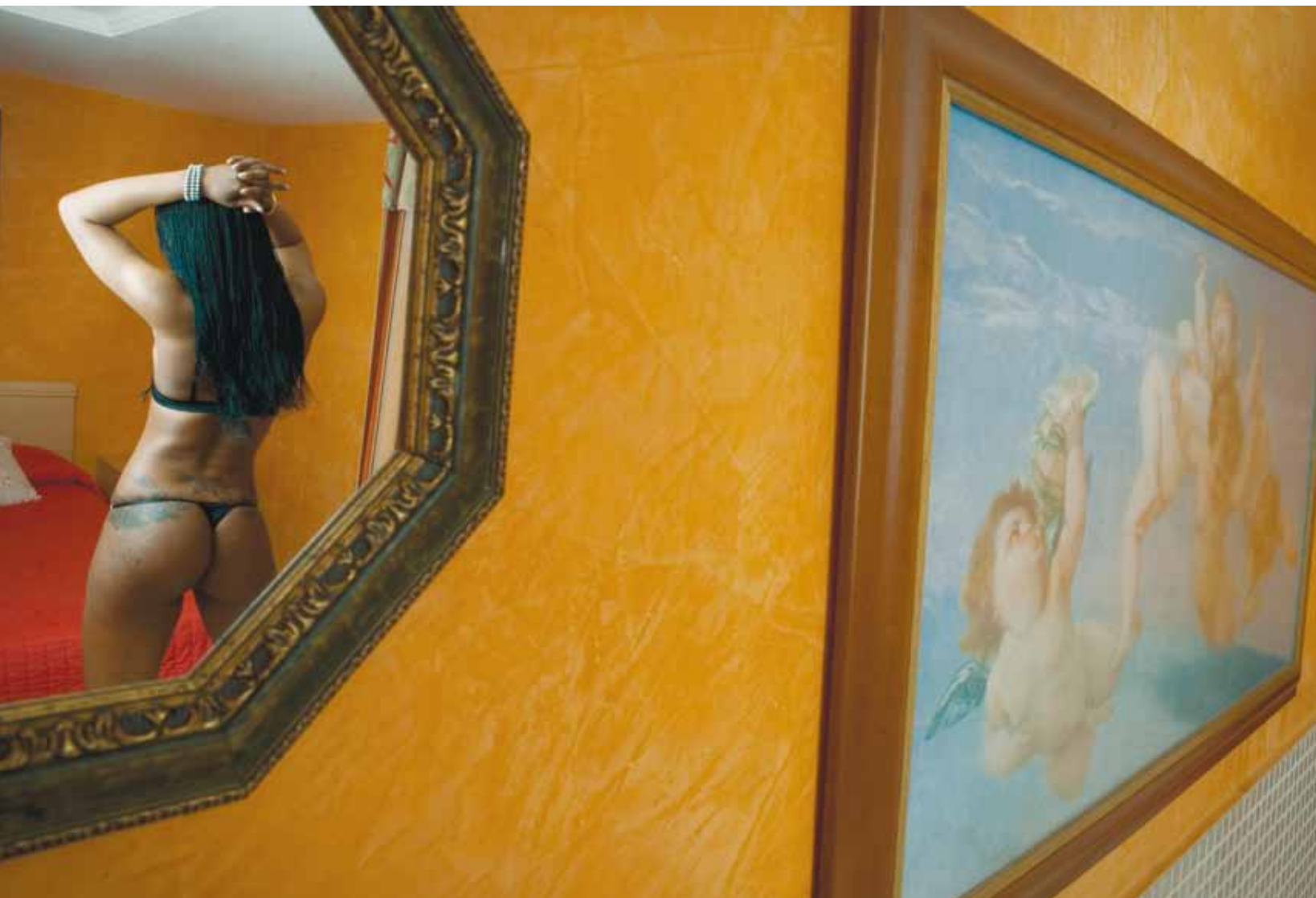
■ Un club de alterne en Oviedo.